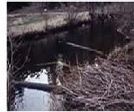
(Uwch ben) Gosod rheoleiddiwr llif mewn argae i reoli lefel dŵr pwll (Chwith) Helygen wedi'i thocio gan afanc

er mwyn cyrraedd y canghennau uchaf i fwyta'r rhisgl yn ystod y gaeaf ac er mwyn adeiladu llety ac argaeau. Mae'r rhan fwyaf o rywogaethau o goed brodorol yn adfywio, sy'n arallgyfeirio strwythur y cynefin o amgylch ac yn creu ardaloedd o llystyfiant gydag uchder ac oedran cymysg yn y llystyfiant.